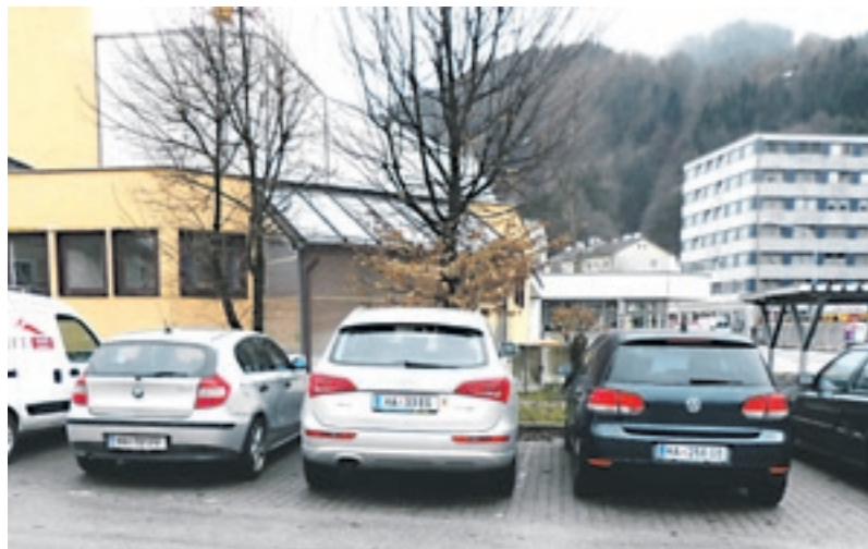
Gratisparken auf dem Parkplatz bei der Salzberghalle gehört bald der Vergangenheit an.

Parkplätze Pernerinsel und Salzberghalle ab 1. Jänner gebührenpflichtig