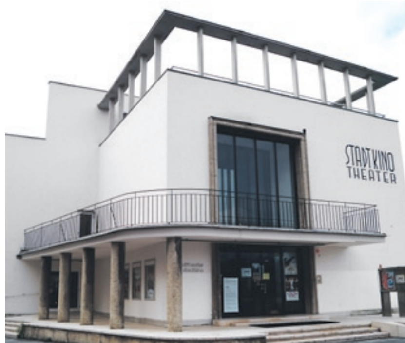
Die Alp-Con Cinematour: Aktuelle Programminfos unter: www.hallein.gv.at/kultur_freizeit/film_kino .

24. November: Snow - der fluffig weiße Filmblock. Beginn jeweils 20 Uhr. Aktuelle Programminfos unter: www.hallein.gv.at/kultur_freizeit/film_kino . JW